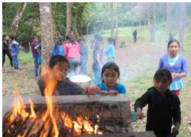
UTFLYKT. En dag fick lärarna följa med tjejerna i systugan på utflykt till floden Salchilá.