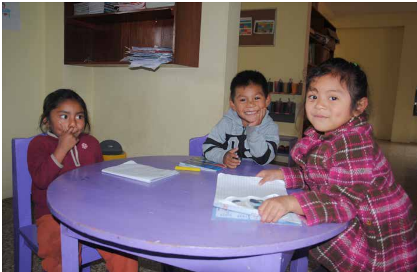
TRIVS. På Regnbågens förskola får barnen en första kontakt med skolsystemet. Det blir en mjukstart då lärarna förutom spanska talar deras modersmål chuj.