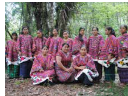
EXAMEN. Avslutning på Nip-kursen augusti 2018.