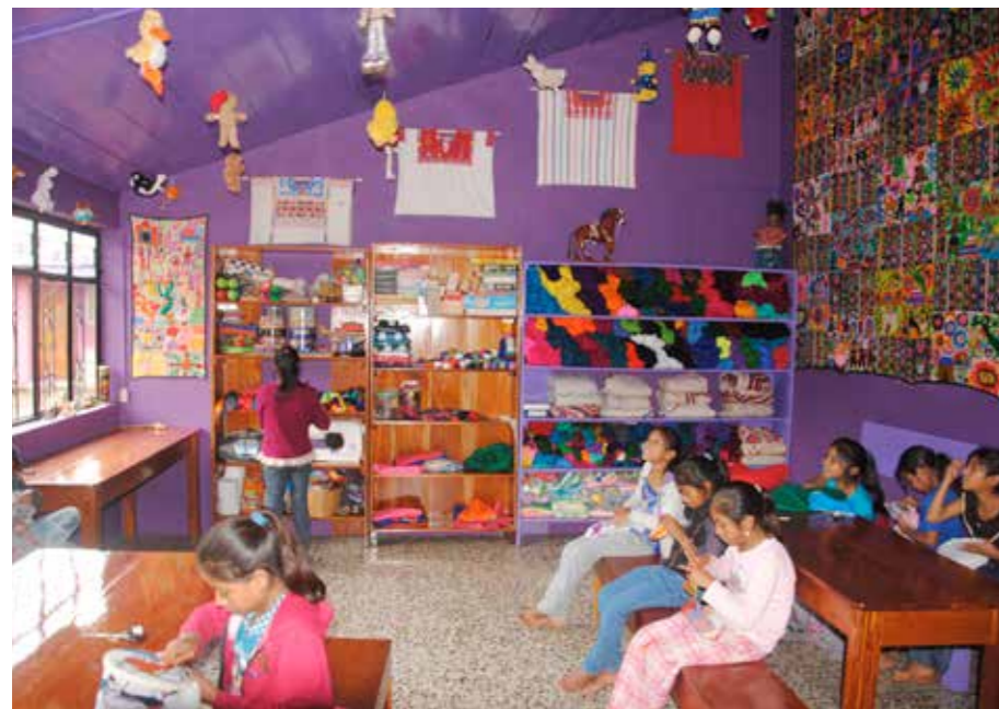
FÄRGGLATT. Chujfolkets traditionella dräkter är färgsprakande, och den nya lokalen är inredd i samma stil. Tjejerna stortrivs.

I slutet av nittiotalet och fram till 2010 var föreningen Brödet och Fiskarna vår största givare till verksamheten i Yalambojoch. Nu har vi återupptagit samarbetet, genom en renovering av systugans lokaler.