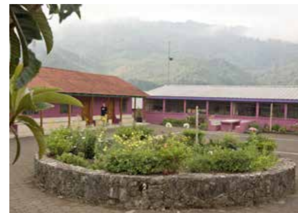
FRIDFULLT. Tidig morgon i centret Niwan Nha, där såväl förskola som högstadium, Folkets hus och övernattningsrum finns.