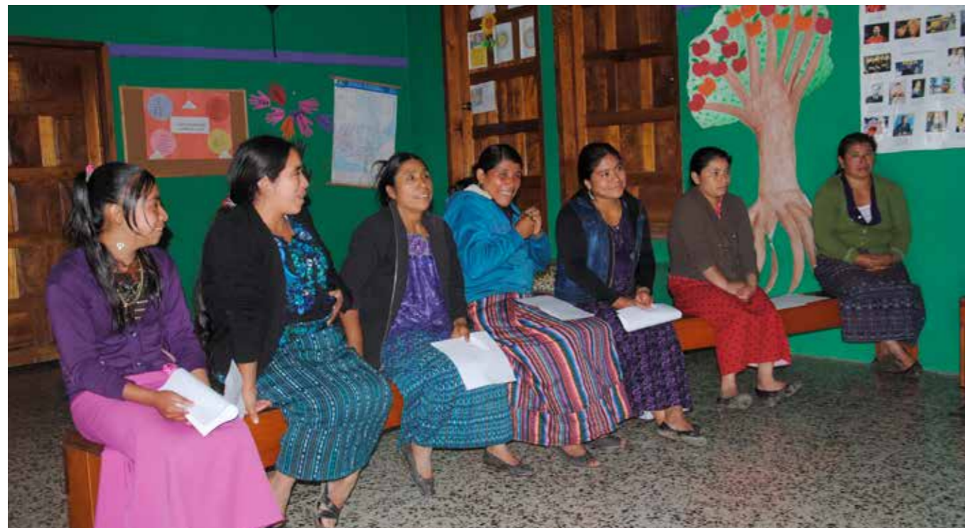
MAMMOR. Sista föräldramötet i högstadieskolan. I dagsläget har inte byns föräldrar möjlighet att driva skolan på egen hand.

Orosmolnet, att vi skulle tvingas stänga högstadieskolan, har legat över oss ända sen svenska kronan började tappa sitt värde för fyra år sedan. Ansträngningarna från sponsorlopp och dagsverken har varit stabila i Sverige men omvandlats till allt färre quetzales.