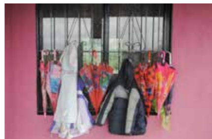
REGNIGT. Vid ingången till förskolan slänger barnen av sig paraplyerna. De flesta barn går själva till och från förskolan.

Vi kommer att dela upp barnen i två grupper. I den första gruppen finns de barn som är klara för en högre nivå av lärande. Där fokuserar vi på läsande och skrivande för att det ska gå så lätt som möjligt för dem när de börjar i statliga skolan. I den andra gruppen finns barn som just börjat på förskolan och de som har svårare att lära sig.