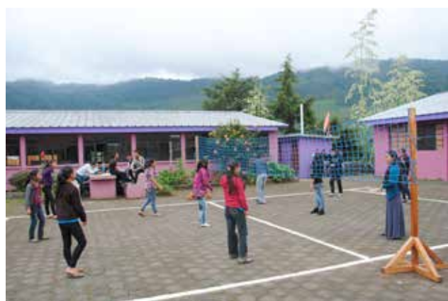
LÄGGS NER. Föreningen CNL har inte möjlighet att driva högstadiet vidare.