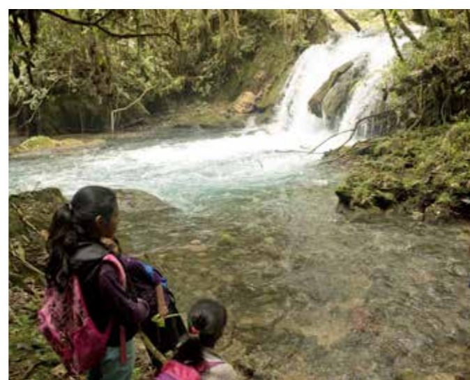
TILLGÅNG. Rent vatten är en av byns största tillgångar. Här ett vattenfall i Rio Salchilá.