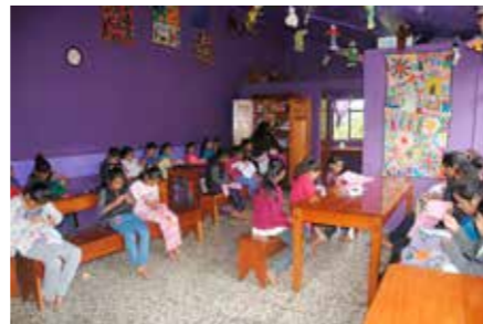
SAMVARO. Fritidsgården La Textilería är ett roligt avbrott i tjejernas vardag och en möjlighet att lära sig textilt hantverk.