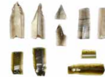
FYND. Överst grå obsidian och nederst grön obsidian.

Byn Yalambojoch ligger vid foten av bergskedjan Altos Cuchumatanes, 1600 meter över havet. Norr om byn hittar man sjön Yolnhajab, regionens största sjö. Klimatet är subtropiskt och fuktigt. Inom byns områden hittar man flera arkeologiska platser som har studerats i vårt projekt PAR-CHA (Proyecto Arqueológico de la Región de Chaculá) under 2018.