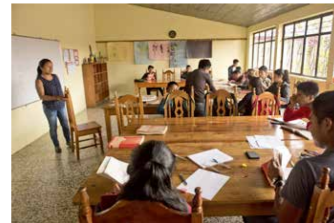
UNDERVISNING. Matematik i högstadieskolan.