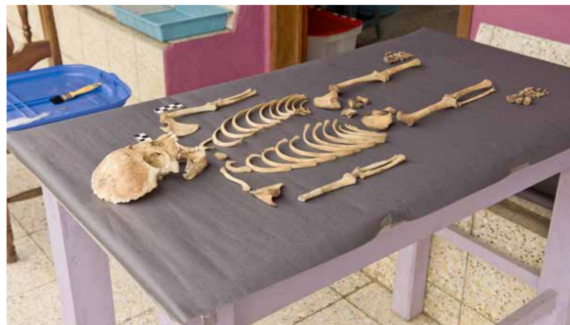
FYND. Barnskelett från utgrävningarna på Unin Witz.

till sjön Laguna Yolnhajab. Vi vandrade genom olika typer av odlingslandskap genom en för oss helt annorlunda miljö. Naturen var rik på fjärilar, fåglar och växter.