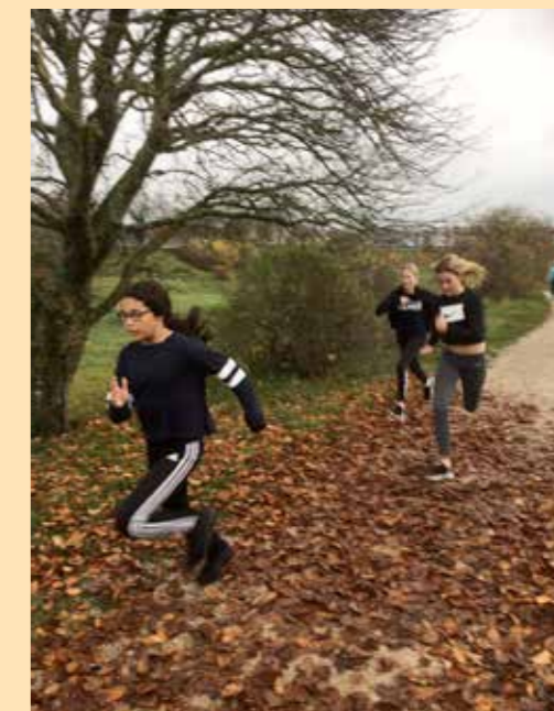
ENGAGERADE. Eleverna på Norrbackaskolan i Visby sprang in drygt 40 000 kronor på sitt första sponsorlopp.