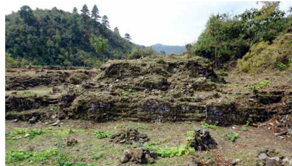
RUIN. Huvudbyggnaden på Unin Witz i Yalambojoch.