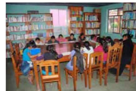
LÄSSUGNA. Fritidsstjerna använder ibland biblioteket när de behöver koppla av från handarbetet.

oteket och årets inköp har till största delen varit barn- och ungdomslitteratur. Med enstaka udda böcker som Knut Hamsuns Sult på spanska och Friedrich Nietzsches filosofi.