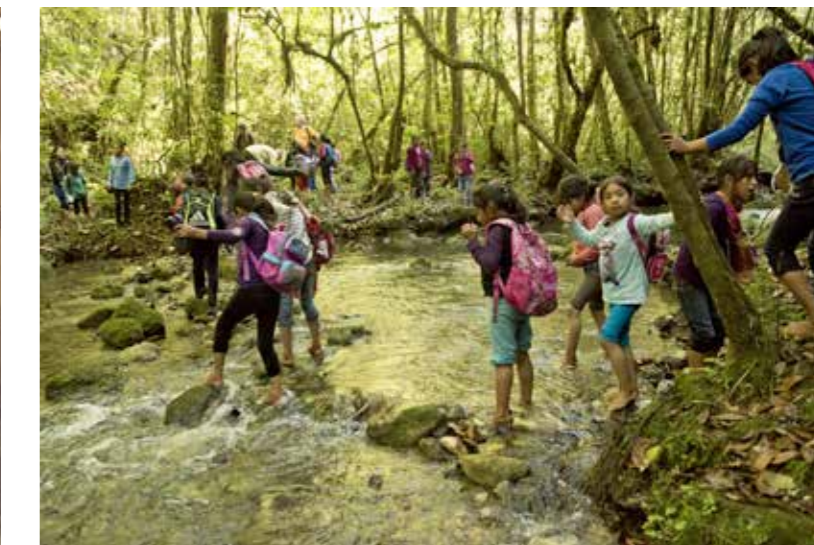
FLODLEK. Utflykt till Rio Salchilá med fritidstjejerna.