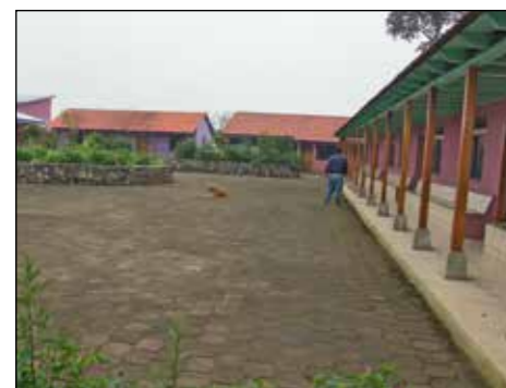
KURSGÅRD. På byns höga kulle har bybor och CNL byggt upp kulturcentret Niwan Nha. Här finns idag bibliotek, förskola, fritidsverksamhet, högstadieskola med lärarbostäder och Folkets hus.

Fram till i mitten av 1990-talet stödde vi flyktingarna i deras exil i Mexiko, främst med omfattande markköp, som blev tre bosättningar, "rancher", där flyktingarnas kaffeodlingar blev den huvudsakliga inkomstkällan. För eget behov odlar de majs, svarta bönor, bananer och andra frukter. På rancherna hjälpte vi till med att bygga bostäder, skolor, kliniker och affärer. De flyktingar som valde att stanna kvar på rancherna i Mexiko klarar sig nu på egen hand.