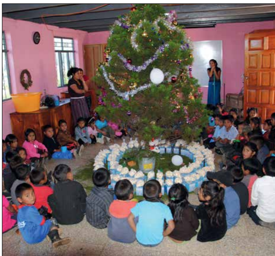
JUL I FÖRSKOLAN. På förskolan Regnbågen firas julen traditionellt på julaftons förmiddag, med bland annat julklappsutdelning.

Julhelgen 1996 rådde fredsyra i Guatemala. Efter mer än trettio års inbördeskrig undertecknades ett fredsavtal mellan regeringen och URNG-gerillan. De första fredsåren fanns en optimism, en tro på förändring. Att staten skulle ta sitt ansvar för god utbildning även i de mest avlägsna byarna som Yalambojoch. Den högerinriktade presidenten Alvaro Arzu undertecknade ett avtal med Castro och tusentals kubanska läkare sändes till Guatemala. Idag kollapsar den offentliga sjukvården i Guatemala. Anställda har inte fått lön på