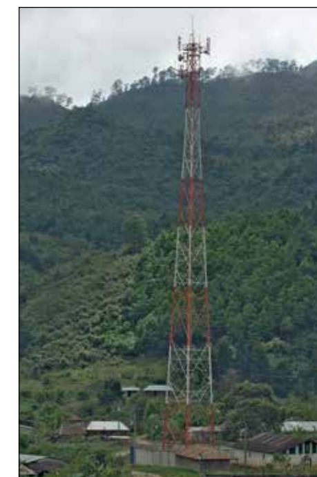
MOBILMAST. För tio år sedan skötte alla byns invånare sina telefonsamtal hos de fåtal familjer som hade egen telefon. Numera är det många som har egna mobiltelefoner.