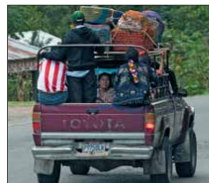
UTVECKLING. För bara några år sedan fanns inga bilar i Yalambojoch. Numera har flera familjer haft råd att köpa pick-up.