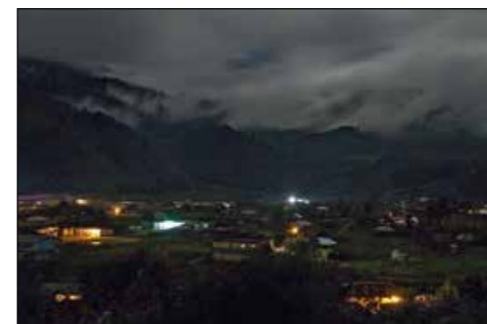
ELEKTRIFIERAT. Så här ser Yalambojoch ut – en kväll utan strömavbrott. Elförsörjningen till byn fortsätter att vara minst sagt svajig.