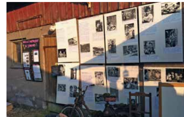
INFORMATION. En liten fotoutställning gav festivalbesökarna kortfattad information om CNL:s projekt i Guatemala.

Ange barnets namn Apartado Postal # 4 Huehuetenango GUATEMALA