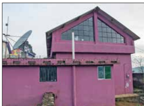
LÄRARBOSTAD. I den här byggnaden finns plats för de av högstadieskolans lärare som kommer utifrån för att undervisa i byn.

Därför har vi under senare år satsat en stor del av våra insamlade biståndsmedel på att utveckla kultur- och utbildningscentret på kullen i byn, där det förr låg en Mayaruin. Där har det först byggts en förskola, senare bibliotek, kurslokaler, en högstadieskola med lärarbostäder och slutligen ett Folkets Hus. Allt runt det fina, stenlagda torget.