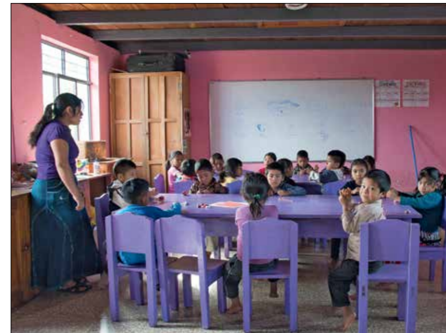
UNDERVISNING. Byns förskola har inneburit bra mat, lek och kunskap i spanska för hundratals barn i Yalambojoch.

Sammantaget kan vi vara stolta över vårt